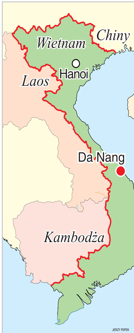
Lekarze z Rzeszowa pomagali chorym w szpitalu w Da Nang