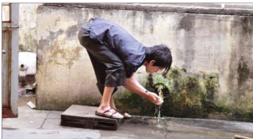
Na oddziale ortopedycznym nie ma łazienek. Aby się umyć, pacjenci muszą wychodzić na zewnątrz.